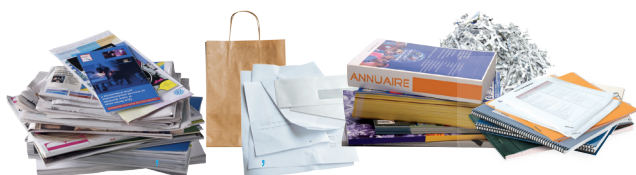
Magazines, journaux, enveloppes, lettres