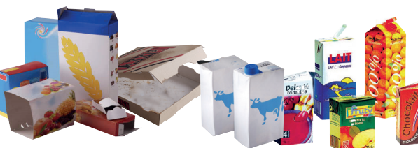
Cartonnettes, briques alimentaires