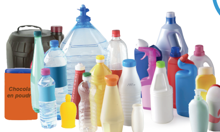
Bouteilles, flacons, bidons en plastique