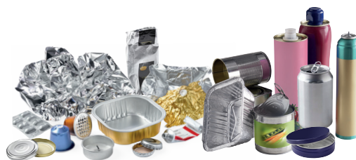
Emballages en acier et en aluminium