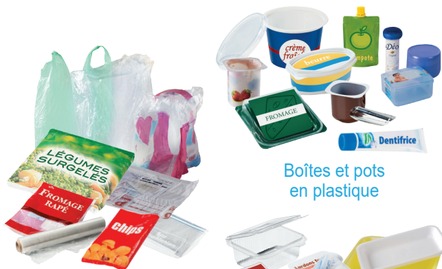
Sacs, suremballages et films en plastique