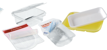
Barquettes en plastique et en polystyrène